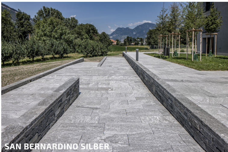
SAN BERNARDINO SILBER