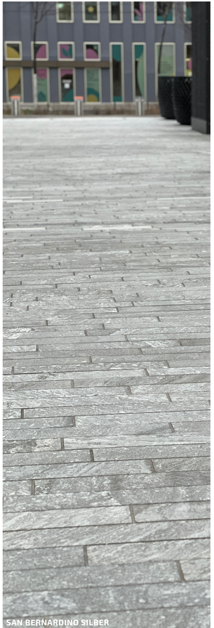
SAN BERNARDINO SILBER