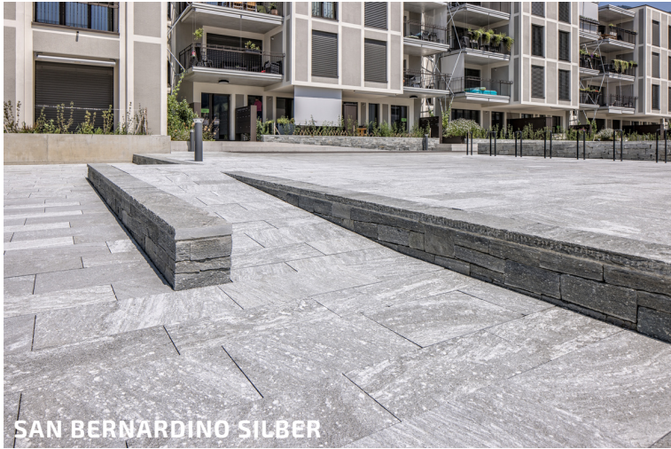
SAN BERNARDINO SILBER