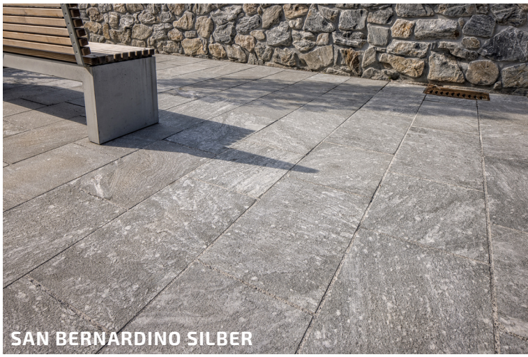
SAN BERNARDINO SILBER